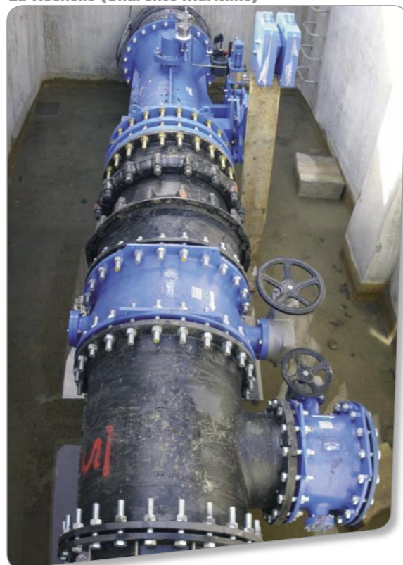
Alimentation du château d'eau La Rochelle (Charente-Maritime)

Imp. Les Presses de la Terrasse et la Parfaite certifiées imprimant • Crédit photos : Fotolia.com - SOC • Conception : Groupe NGE - communication Externe & La Sud Compagnie