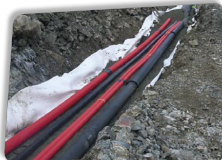
Réseaux neige Gourette (Pyrénées-Atlantiques)