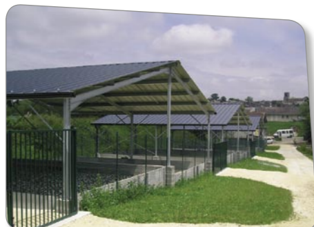
Station d'épuration - lits de séchage Sauveterre (Gironde)