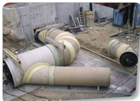
Station d'épuration Bègles (Gironde)

Cet adossement patrimonial et l'accroissement de son champ de compétences contribuent, avec l'appui des implantations du Groupe, à l'évolution de l'entreprise dans sa capacité à apporter des solutions globales dont les clients sont de plus en plus demandeurs.