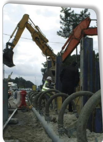
Réseau d'assainissement Cap-Ferret (Gironde)